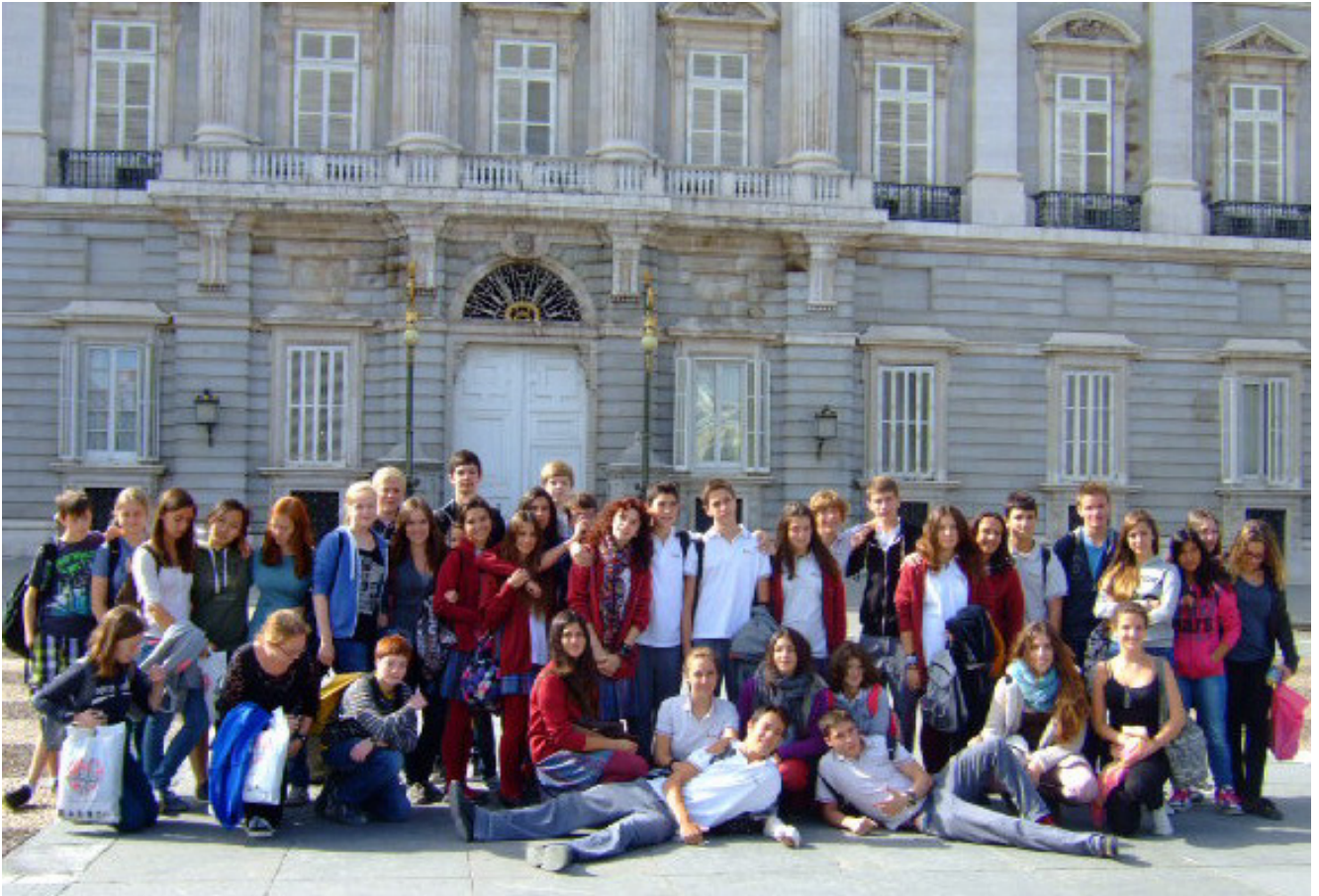
Vor dem Palacio Real

Heute waren wir in Madrid und haben uns die Stadt angeguckt. Zuerst hatten wir ein bisschen Freizeit, um uns die Plaza Mayor anzugucken und anschliessend schauten wir uns den Palacio Real , den Königspalast, an: