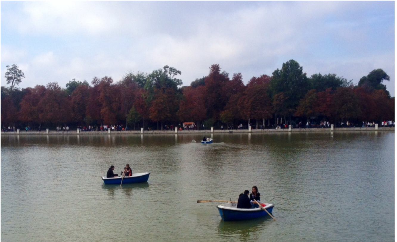
Im Retiro Park, Madrid

Am Sonntag frühstückte ich zunächst typisch spanisch churros con chocolate und fuhr dann mit meiner Gastfamilie in die Hauptstadt. Wir spazierten durch den Retiro Park mit seinem See zum Gondelfahren und sahen unter anderem auch die grandiose Plaza Mayor und die Puerta de Sol , an der die Spanier jedes Jahr Silvester feiern.