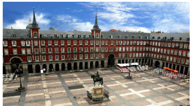
Die Plaza Mayor , Madrid

Madrids Wappentier, der oso y el madroño , an der Puerta del Sol (Tor der Sonne)