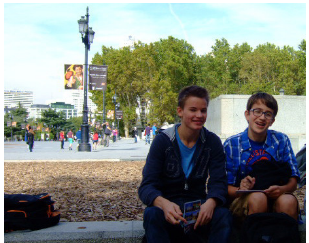
Pause: Zeit für eine Postkarte nach Hause.